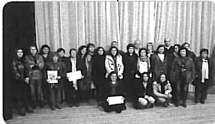
uma das formandas.