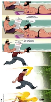
Vem aí chuva da grossa