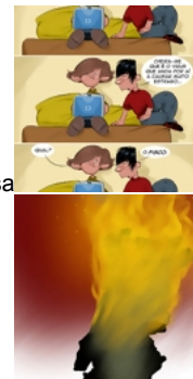
O berro do Magalhã