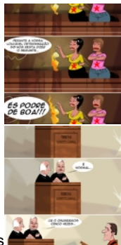
Morte ao piropo