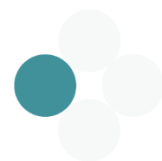
Quadro 12 | Sistema de notificação do alerta aos agentes de proteção civil, organismos e entidades de apoio