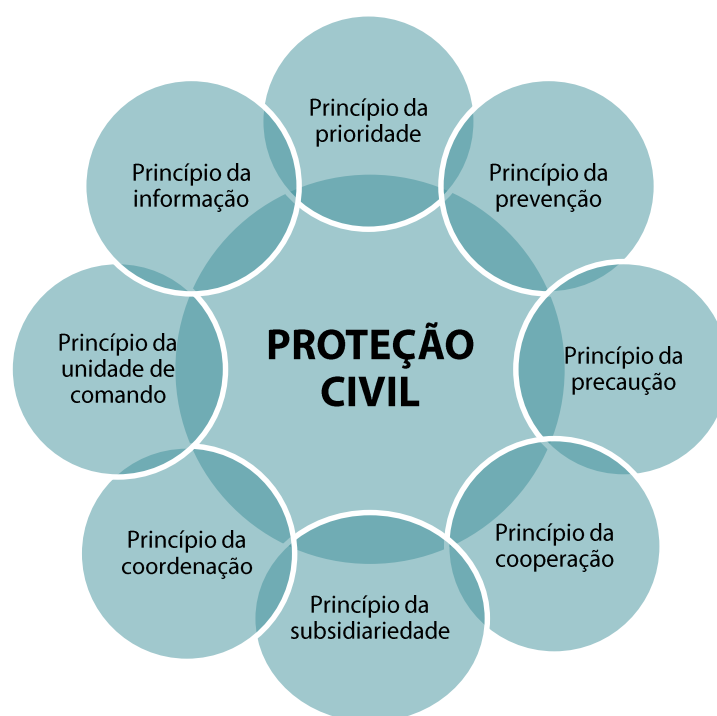
Figura 1 | Princípios da atividade da proteção civil

Por último, assumem-se com principais objetivos da proteção civil: