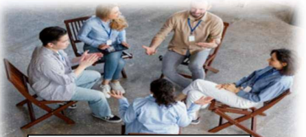
Conversas Entre Nós

Com 23 fantásticas disciplinas à escolha e novos projetos extracurriculares, venha enriquecer-se, socializar e sobretudo passar um bom tempo!