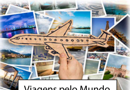
Viagens pelo Mundo