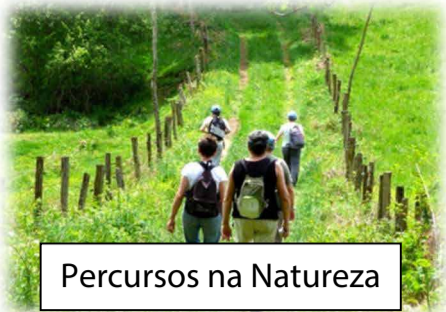
Percursos na Natureza