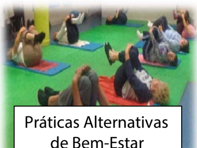
Práticas Alternativas de Bem-Estar