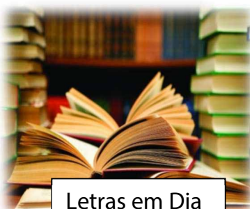
Letras em Dia