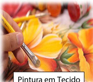
Pintura em Tecido