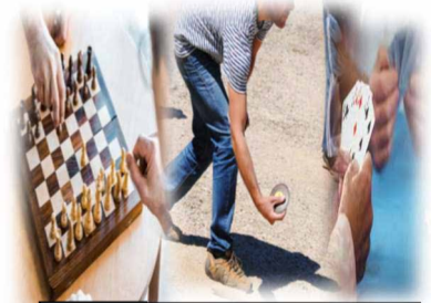
Jogos de Sociedade e Competição

Traga consigo um novo aluno e ganhe um bónus!