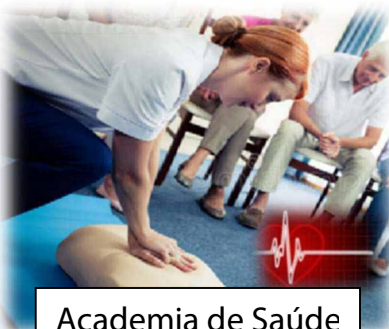
Academia de Saúde