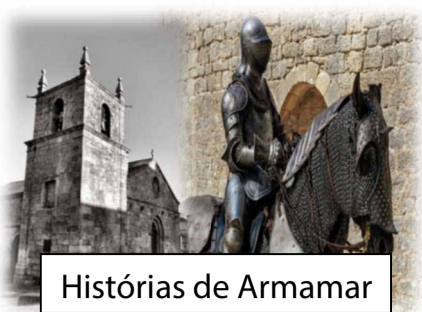
Histórias de Armamar